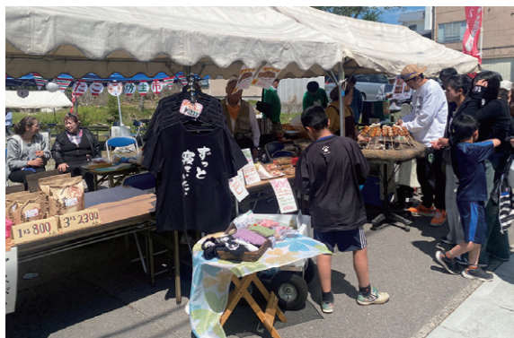
地元のグルメなどが出店されたマルシェ