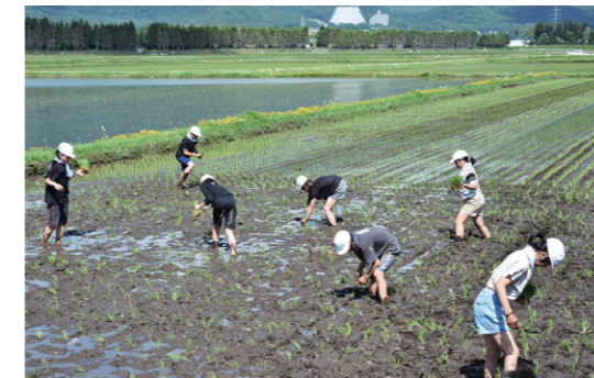
丁寧に苗を植える二小の児童