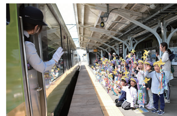
ホームで乗客に手を振る園児ら

大型観光企画「ふくしまデスティネーションキャンペーン(DC)」を盛り上げようと、園児たち約100人がホームに並び、手作りのこいのぼりでお出迎え。ほほ笑ましいおもてなしに、列車の乗客は笑顔で手を振って応えていました。