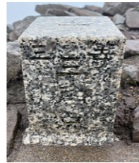
山頂の三等三角点「磐梯」