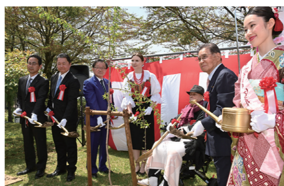
シダレザクラの苗木を植樹する関係者ら