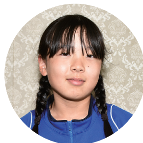
猪苗代第二小学校 6年

日没時、水平線に沈む太陽の光で赤く染まる空と海を描きました。空は、赤・オレンジ・黄色のグラデーションで夕焼けを表現し、海は水色と青色で塗り、筆のタッチで波の様子を表しました。