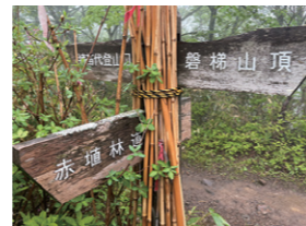
分岐点に設置されている道標