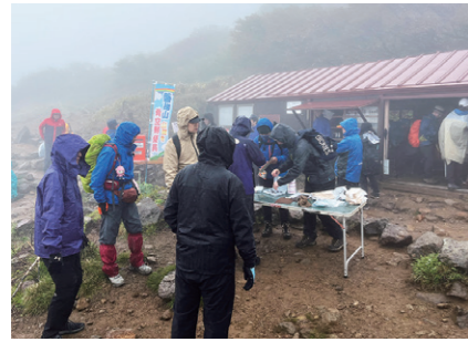
山頂手前の弘法清水は霧に覆われ、周囲は真っ白な景色となっていました