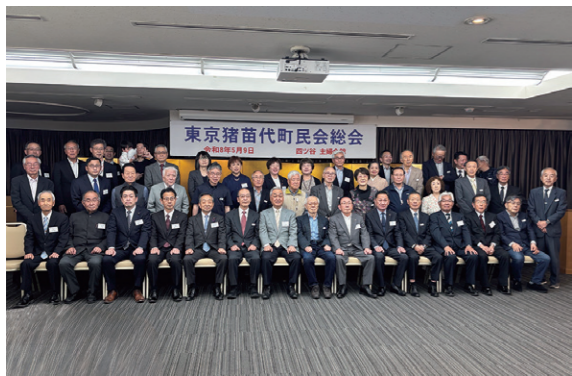
総会に出席した会員の皆さん