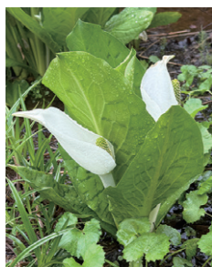
登山道沿いに咲く ミズバショウ