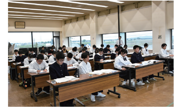
行政の役割や事業について学ぶ生徒たち

猪苗代高校の1年生30人は5月8日、町役場を訪れ、本町の「農業」「防災」「観光」の3分野について理解を深めました。これは、地域探究活動「猪苗代学」の一環として行われたものです。当日は、各課の担当職員が、各分野における行政の取り組みなどについて説明。観光分野では、震災前後の観光客入込状況の変化や、誘客に向けた取り組みなどが紹介され、生徒たちは担当職員の話に熱心に耳を傾けていました。