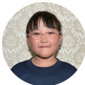
猪苗代第二小学校 1年